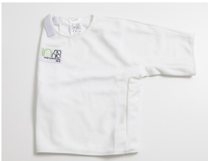
Peto de esgrima

Peto: es común a las tres armas, aunque suele usarse más bien en espada. No tiene costuras en la zona de la axila y su objetivo es dar una protección adicional a esa zona, la más expuesta. Y cubre la parte del brazo armado. Las mujeres utilizan adicional un peto plástico semirrígido llamado coraza. Una especie de sujetador con forma de pecho.