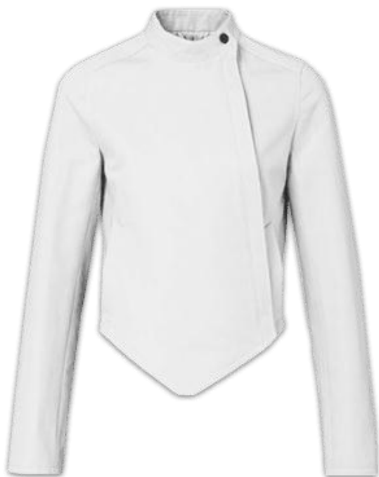
Chaquetilla de esgrima

Peto: es común a las tres armas, aunque suele usarse más bien en espada. No tiene costuras en la zona de la axila y su objetivo es dar una protección adicional a esa zona, la más expuesta. Y cubre la parte del brazo armado. Las mujeres utilizan adicional un peto plástico semirrígido llamado coraza. Una especie de sujetador con forma de pecho.